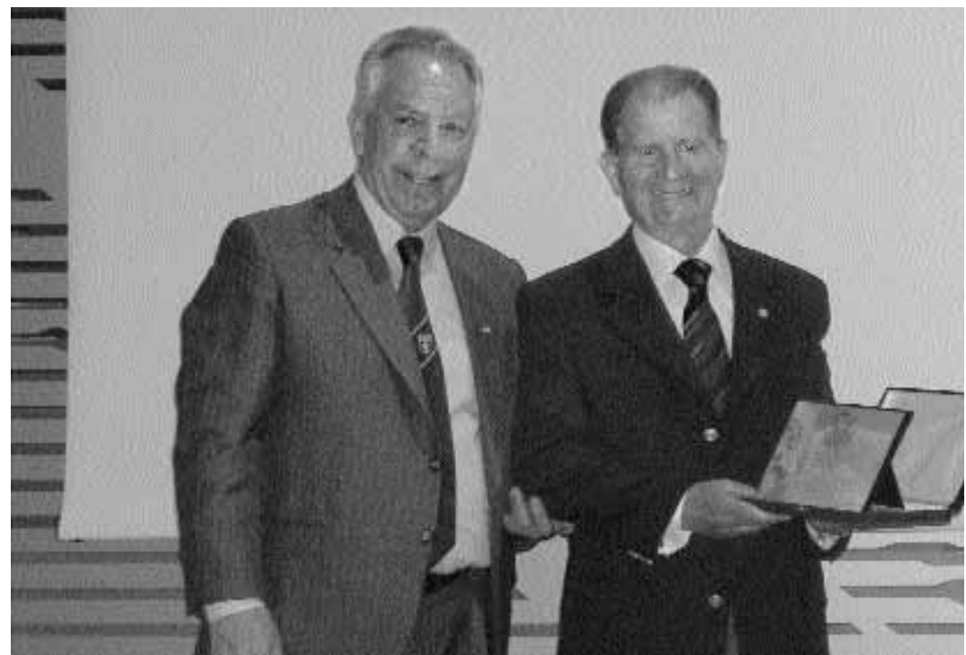
Από την εκδήλωση απολογισμού έργου της Α' Ουρολογικής Κλινικής Α.Π.Θ. (23 Απριλίου 2005)

• 11 ο Μετεκπαιδευτικό Σεμινάριο Αναισθησιολογίας και Εντατικής Θεραπείας και 8 ο Σεμινάριο Νοσηλευτών, 3 και 4 Δεκεμβρίου 2005, Αίθουσα Τελετών Πανεπιστημίου Μακεδονίας Οικονομικών και Κοινωνικών Επιστημών, Θεσσαλονίκη, τηλ.:2310-999341,999346,Fax:2310-999331,e-mail:11scminar@anesthesiology.gr, Web: www.anesthesiology/seminar .