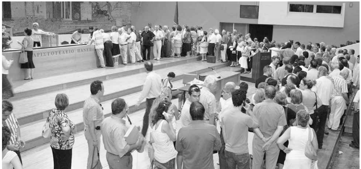
Η προσέλευση του εκλεκτορικού σώματος στην εκλογική διαδικασία ήταν αθρόα. Προσήλθαν και ψήφισαν 905 εκλέκτορες.