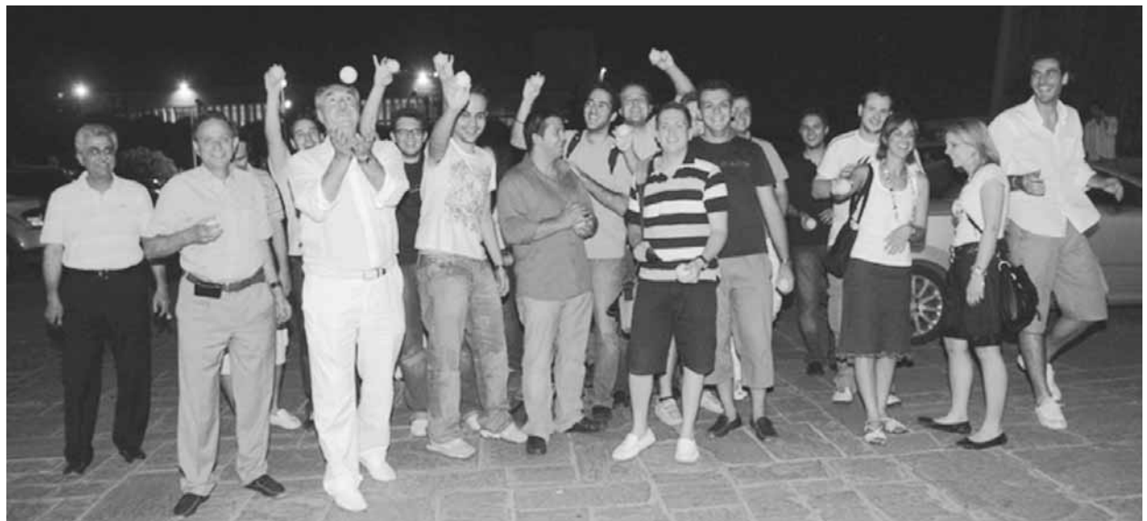
Στις 11 το βράδυ με την ανακοίνωση των τελικών αποτελεσμάτων.

Η έκδοση του Ενημερωτικού Δελτίου είναι ευγενική προσφορά του εκδοτικού οίκου