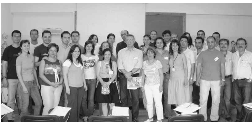
Οι συντελεστές και εκπαιδευόμενοι του 4 ου Σεμιναρίου τραύματος (ATLS) παραρτήματος Θεσσαλονίκης